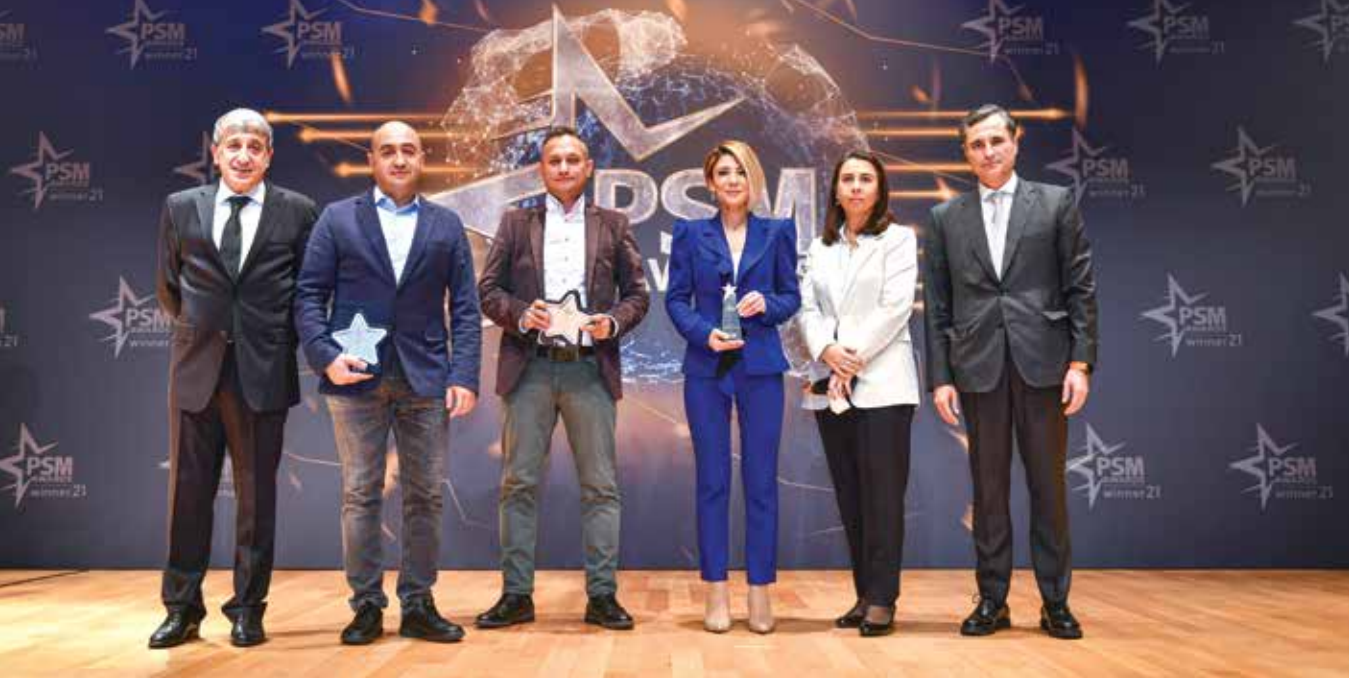
En İnovatif Ürün-Hizmet-Proje kategorisi Gümüş ve Bronz PSM kazananlar...

ait alacaklarını takip etme imkanına kavuşmuş oldu. TekPOS, içinde yer aldığı TekCep'in TekEkstre özelliği gibi bankacılık alanında bir ilk olma özelliği taşıyor. TekPOS halen aktif olarak 1700'ün üzerinde müşteri tarafından kullanılıyor. Bu müşteriler ortalama 2 adet üye işyerini TekPOS üzerinden takip ediyor.